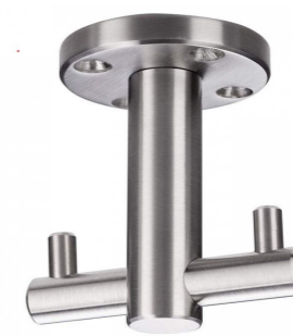
2-fach Drehhaken THANEE Fa. SoTech