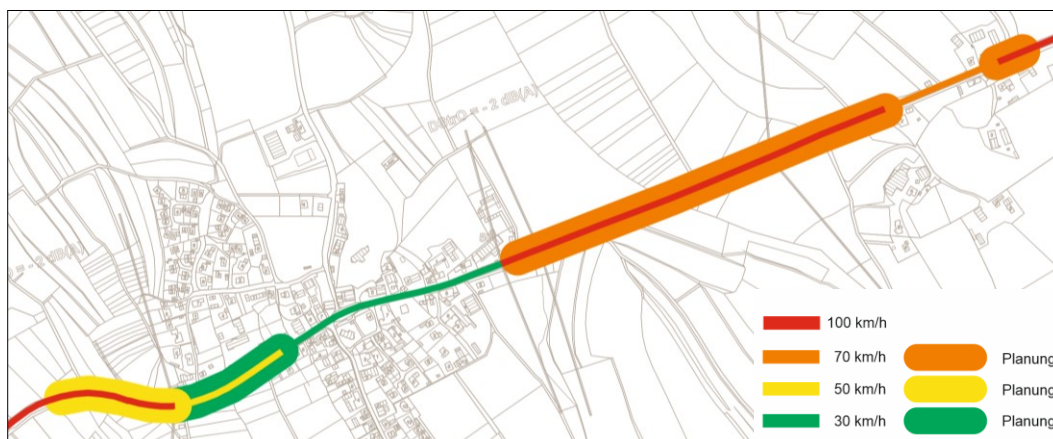
Abbildung 1: Übersicht Wirkungsanalyse, B33 Ittendorf/Wirrensegele

Für die ermittelten Hauptbelastungsbereiche wurden verschiedene Lärminderungsmaßnahmen auf ihre Wirkung hin untersucht (Wirkungsanalyse) und im Anschluss daran erfolgte die Durchführung der Abwägung.