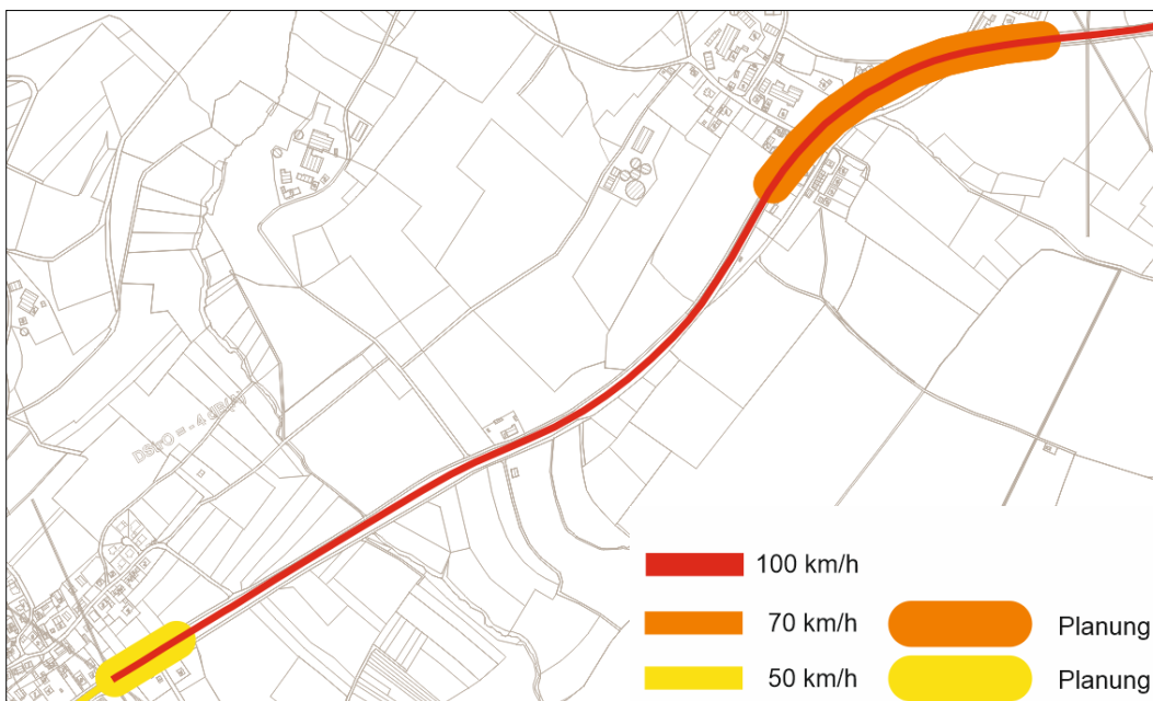
Abbildung 3: Übersicht Wirkungsanalyse, B33 Hepbach/Stadel