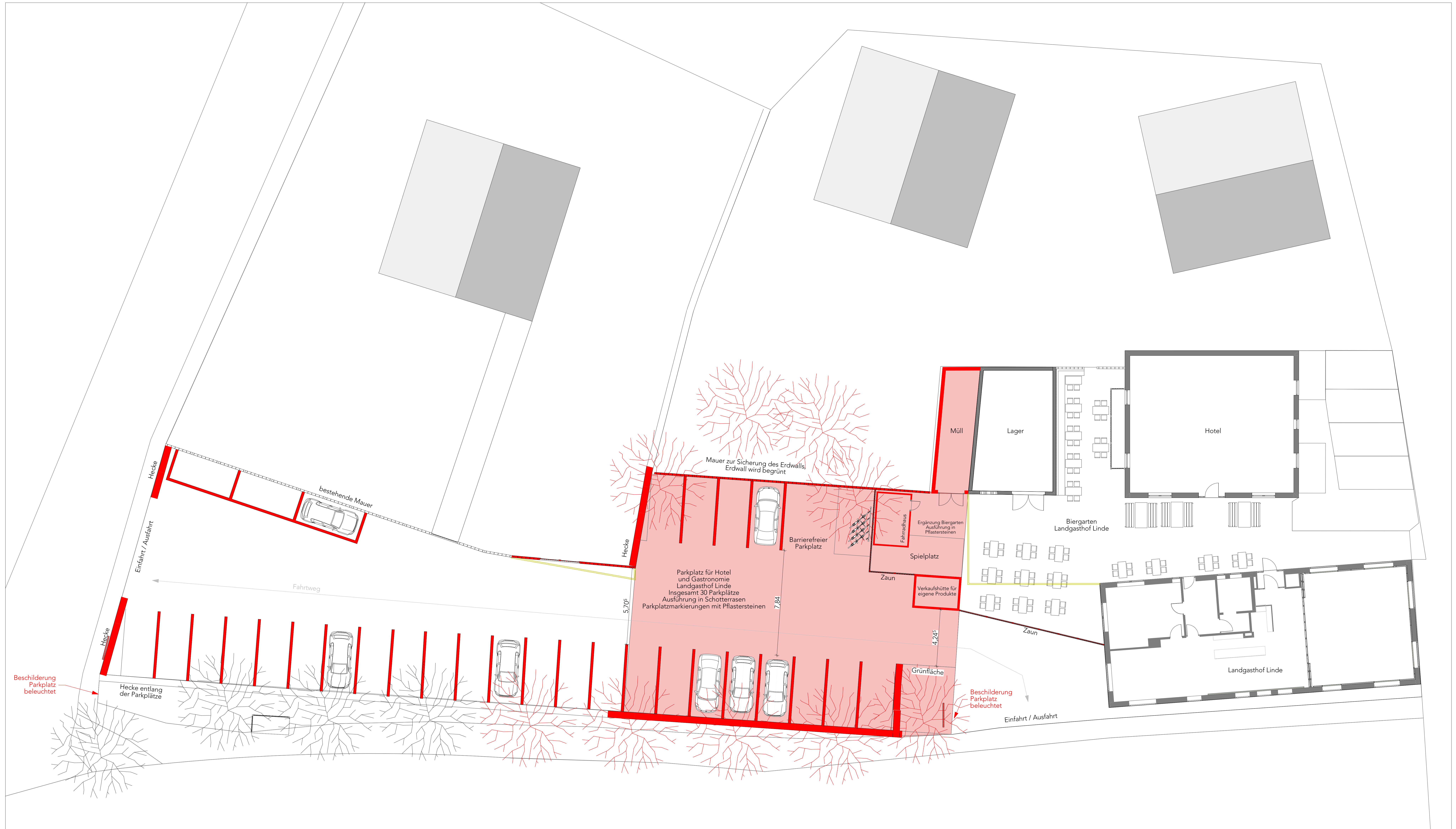
Darstellung der geplanten Parkplätze M1:100