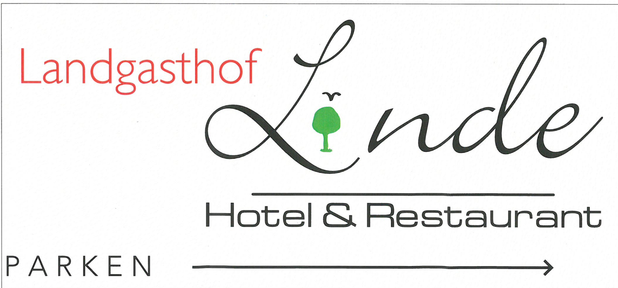
Grafische Darstellung für die Parkplatz Beschilderung