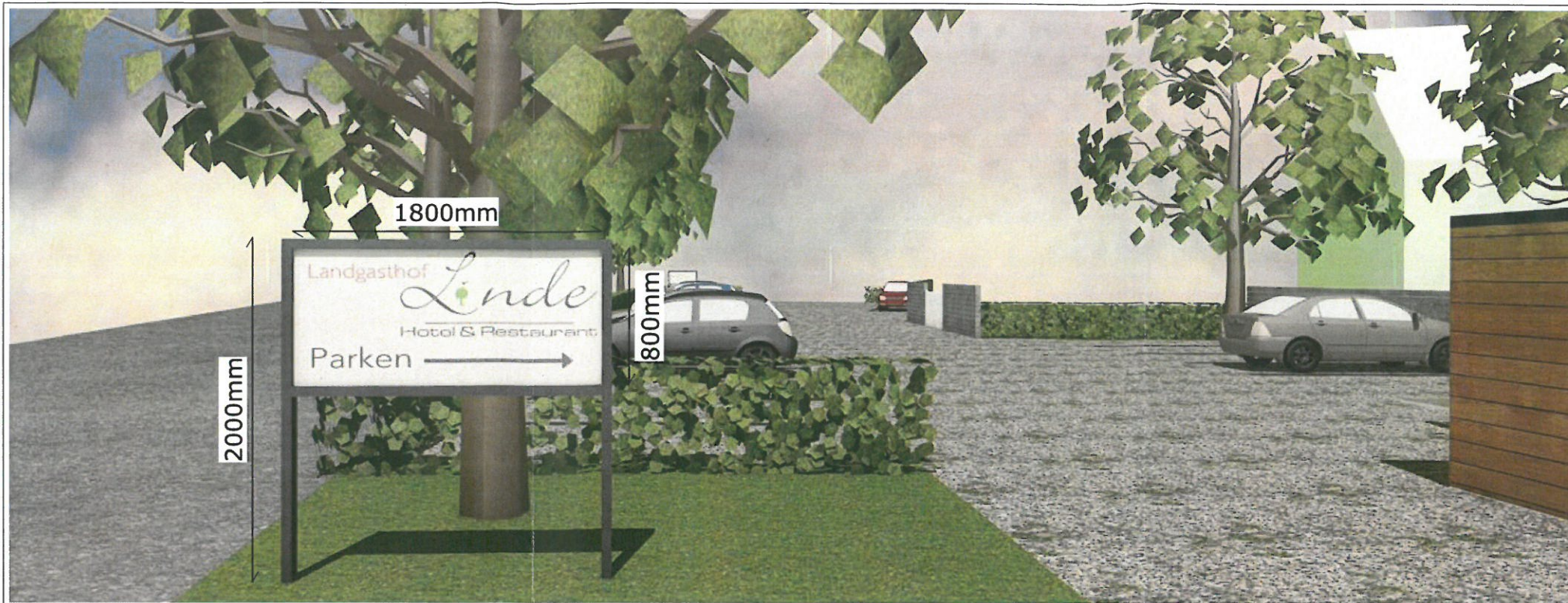
Visualisierung der neuen beleuchteten Parkplatz Beschilderung