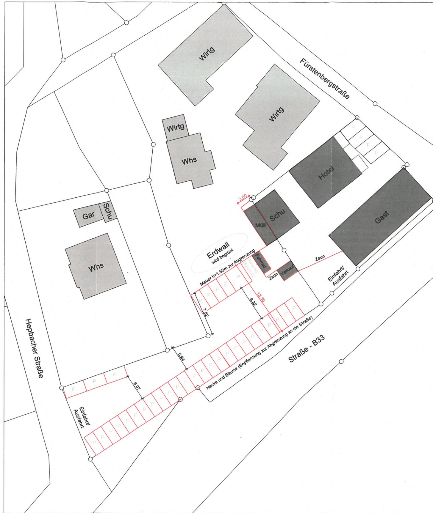
Darstellung der geplanten Parkplätze M1:500