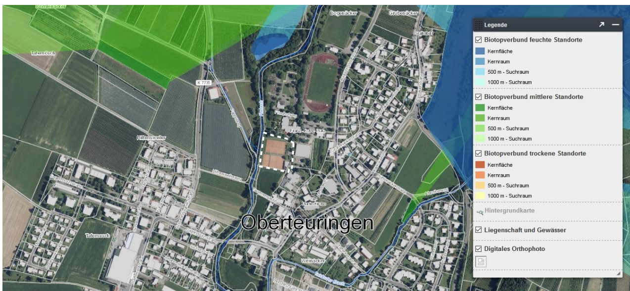
Abb. 8: Biotopverbund (farbige Flächen) in der Umgebung des Geltungsbereiches (weiß gestrichelte Linie)

Der Fachplan „Landesweiter Biotopverbund“ stellt im Offenland drei Anspruchstypen dar – Offenland trockener, mittlerer und feuchter Standorte. Innerhalb dieser wird wiederum zwischen Kernräumen, Kernflächen und Suchräumen unterschieden. Kernbereiche werden als Flächen definiert, die aufgrund ihrer Biotopausstattung und Eigenschaften eine dauerhafte Sicherung standorttypischer Arten, Lebensräume und Lebensgemeinschaften ermöglichen können. Die Suchräume werden als Verbindungselemente zwischen den Kernflächen verstanden, über welche die Ausbreitung und Wechselwirkung untereinander gesichert werden soll.