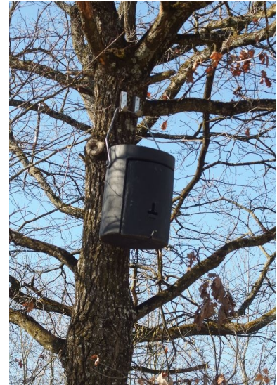
Abb. 10: Fledermaus-Großraumhöhle in der Umgebung des Geltungsbereiches

An einer Eiche entlang des Rotach-Ufers, unweit des Eingriffsbereiches wurde eine Fledermaus-Großraumhöhle aufgehängt. Auf einen Besatz wurde diese während der Begehung zwar nicht überprüft, jedoch wurde auf Anfrage von der Gemeinde mitgeteilt, dass bei einer jüngst stattgefundenen Kontrolle des Kastens durch Mitarbeiter des Bauhofes keine Nutzung durch Fledermäuse nachgewiesen werden konnte. Es wurde dabei jedoch eine Meise innerhalb der Höhle angetroffen.