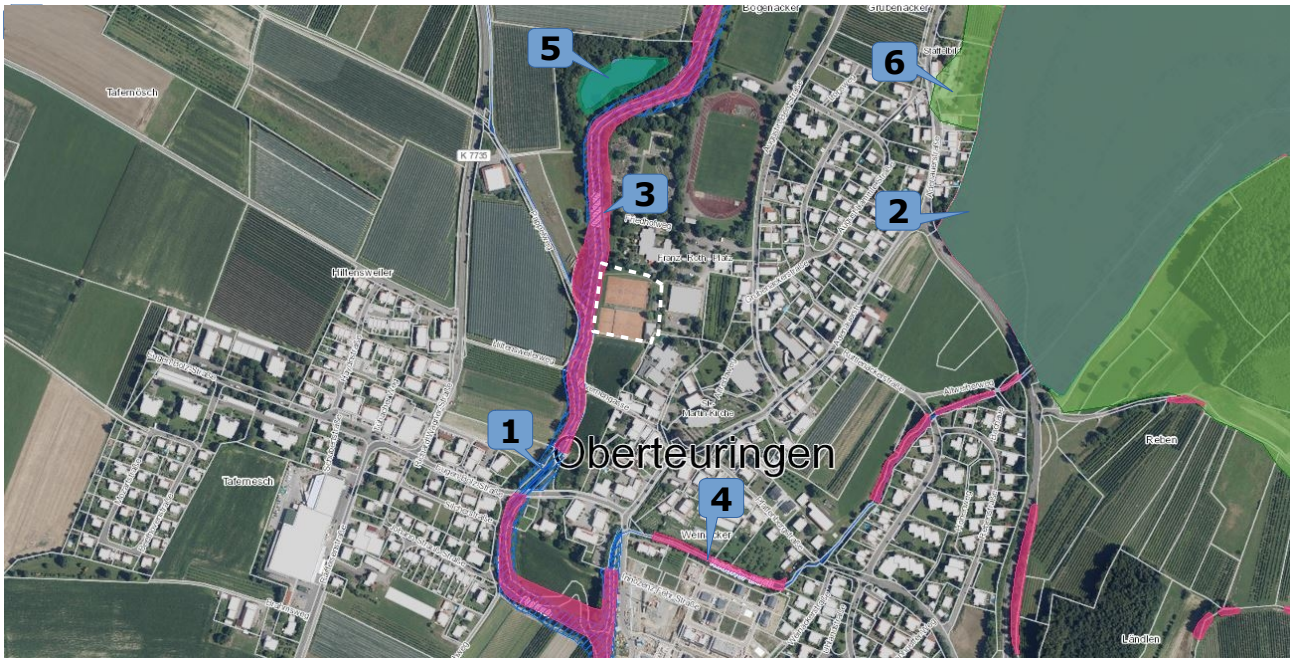
Abb. 7: Orthofoto des Planungsraumes mit Eintragung der Schutzgebiete in der Umgebung.