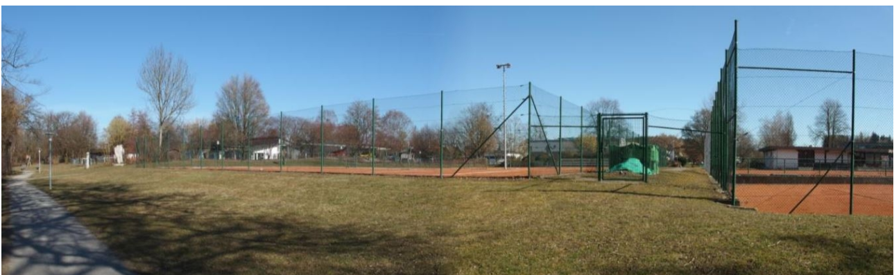
Abb. 5: Überblick über den Geltungsbereich aus süd-westlicher Richtung. Umzäunte Spielfelder des Tennisplatzes mit umgebenden Grünlandflächen und das Vereinsgebäude rechts im Hintergrund.

Bei den Wiesen handelt es sich um häufig gemähtes und artenarm ausgeprägtes Intensivgrünland. Die grasdominierten Bestände werden von Wiesen-Rispengras ( Poa pratensis ), Kriechendem Günsel ( Ajuga reptans ), Gundelrebe ( Glechoma hederacea ), Gänseblümchen ( Bellis perennis ), Kriechendem Fingerkraut ( Potentilla reptans ) und Gemeiner Schafgarbe ( Achillea millefolium ) geprägt.