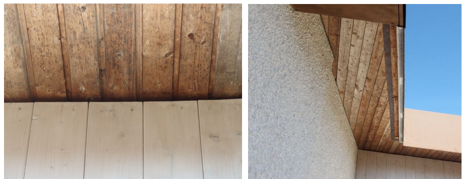
Abb. 9: Spaltenbereiche zwischen dem Dachüberstand und der Außenfassade des Tennis-Vereinsheims.

Zudem wurde auch das Vereinsgebäude nach Nutzungsspuren und potenziell geeigneten Spaltenbereichen abgesucht. Zwischen dem Dachüberstand und der Außenfassade befinden sich kleine Spaltenbereiche, die potenziell als Hangplatz genutzt werden können. Spu-