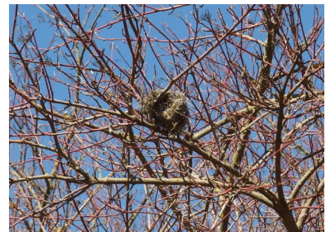
Abb. 11: Altnest eines kleinen Gehölzfreibrüters am Rand des Geltungsbereiches.

Grundsätzlich ist im Gebiet nicht mit dem Vorkommen seltener, störungsempfindlicher Arten zu rechnen, da eine rege Nutzung des Geländes durch Spaziergänger, Fahrradfahrer, Schul- und Kindergartenkinder sowie Tennisspieler stattfindet. Eine Brut ist nur für ubiquitäre, kulturfolgende Arten zu erwarten.