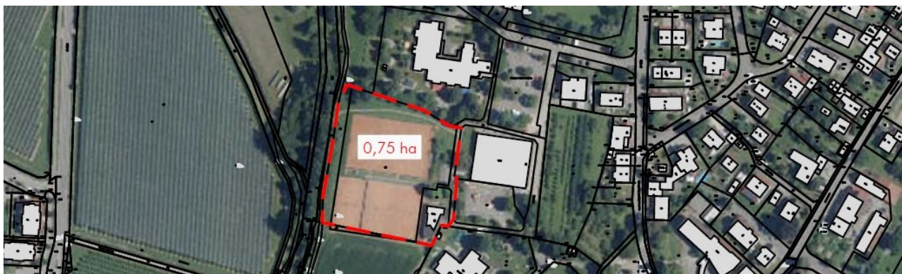
Abb. 2: Grenze des räumlichen Geltungsbereiches des Bebauungsplanes aus dem Abgrenzungsplan.

Nachdem mit der Neufassung des Bundesnaturschutzgesetzes (BNatSchG) vom Dezember 2007 das deutsche Artenschutzrecht an die europäischen Vorgaben angepasst wurde, müssen bei allen genehmigungspflichtigen Planungsverfahren und bei Zulassungsverfahren nunmehr die Artenschutzbelange entsprechend den europäischen Bestimmungen durch eine artenschutzrechtliche Prüfung berücksichtigt werden.