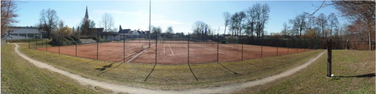
Abb. 4: Überblick über den Geltungsbereich aus nördlicher Richtung. Trampelpfad innerhalb des Intensivgrüns. Umzäunte Tennisfelder mit kleiner Zuschauertribüne (links). Verlauf der Rotach mit uferbegleitenden Gehölzen (rechts).

Die überplante Fläche wird überwiegend von einem Tennisplatz mit sechs Spielfeldern und dem südöstlich gelegenen Vereinsgebäude eingenommen. Randlich und in der Mitte zwischen den nördlich und südlich gelegenen Feldern befinden sich Grünlandflächen und kleinere Gehölzbestände.